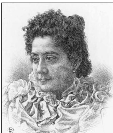
Figura 1. Retrato de la doctora Eloísa Díaz Insunza 5 .

(El Mercurio de Valparaíso, 22 de abril de 1881).