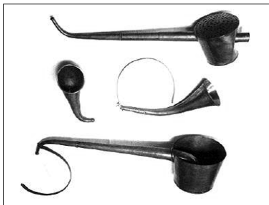
Figura 2. Los implementos que Beethoven usó para ayudarse en su sordera desde 1814.

de alta frecuencia, asociada a severo tinnitus, con pobre discriminación y reclutamiento, indicador de compromiso sensorio-neural. Beethoven usó elementos como trompetas de oído, y una varilla de madera que colocaba en sus dientes (y el otro extremo apoyado en el piano para intentar oír mejor) (Figura 2) 1,2 . Sin embargo, no fueron de real utilidad, ya que el defecto era principalmente sensorio-neural y no de conducción. Mantuvo oculto su déficit por 3 años y recién lo manifestó a su amigo Wegeler en cartas de 1801: “déjeme contarle que mi más preciada posesión, mi audición, se ha deteriorado en estos últimos 3 años, he estado muy desesperado. Para darle una idea en el teatro estoy obligado a inclinarme hacia el escenario para entender a los actores o músicos y por momentos no escucho nada de notas altas de que ellos dan. Frecuentemente, puedo oír una conversación en bajo volumen, pero no logro distinguir las palabras” 8,9 . Ya a esta edad manifestó depresión “el cielo solo sabe lo que va ser de mí... me informaron que mi sordera no tiene cura. Ya he maldecido a mi creador y a mi existencia. Ud.