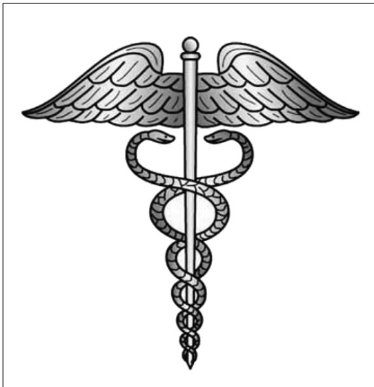
Figura 1. Caduceo de Hermes o Mercurio. En: http://es.wikipedia.org/wiki/Caduceo ; consultado 25/1/2013.

Según la fábula de Ovidio, en la mitología griega, el caduceo fue regalado por Apolo a Mercurio para terminar una disputa entre ellos; Mercurio había regalado al dios de la música la lira de siete cuerdas. Según se dice, Mercurio encontró en el Monte Citerón a dos serpientes que se peleaban, él